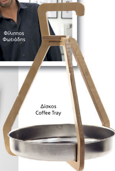
Δίσκος Coffee Tray