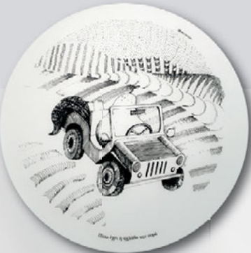
Σουπλά της σειράς Greek Proverb