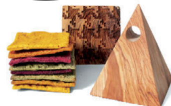
Εύλιες σφραγίδες Designer Baking