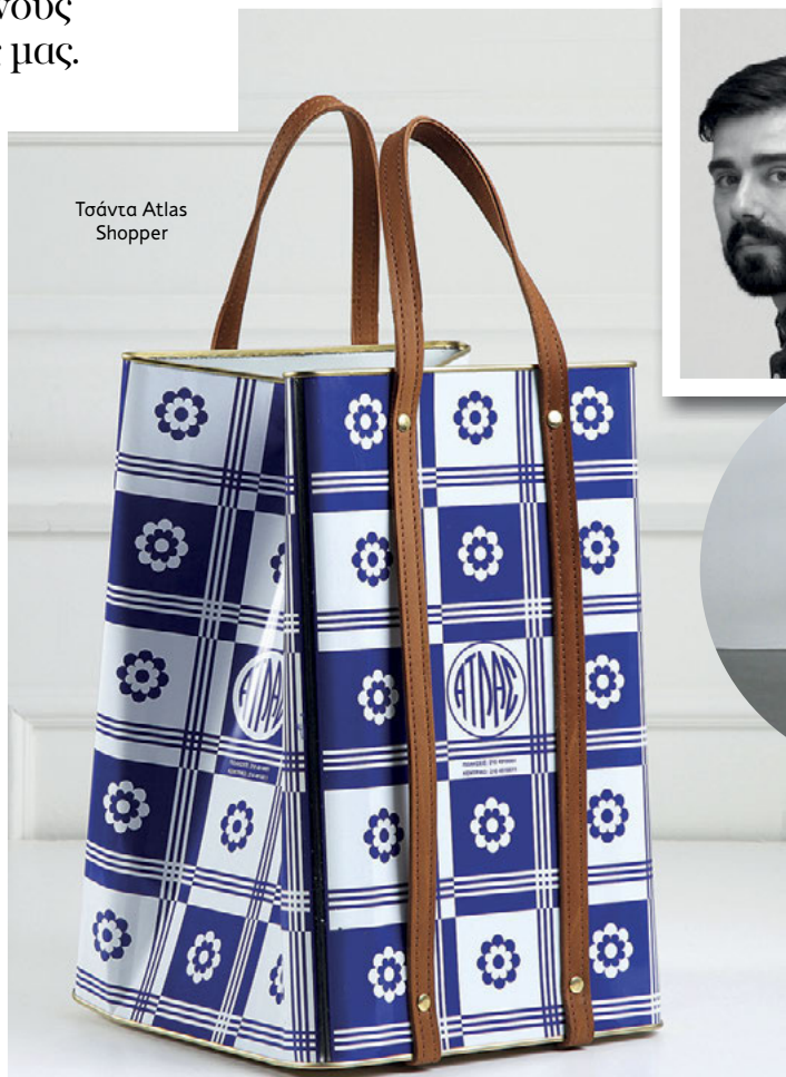
Τσάντα Atlas Shopper

«Υπάρχει μια στροφή σε οτιδήποτε ελληνικό και θα ήταν μάλλον άστοχο να συνδέσουμε το ντιζάιν στην Ελλάδα μόνο με το σχεδιασμό αναμνηστικών αντικειμένων. Φυσικά προσωπικές μνήμες και εμπειρίες που έχουν να κάνουν με τη “γεωγραφία” στην οποία μεγαλώσαμε επηρεάζουν συχνά τη σχεδιαστική σκέψη μας. Κάθε αντικείμενο μπορεί να διηγηθεί μια ιστορία μέσα από το χιούμορ, τις οικείες οπτικές, τις πολιτιστικές αναφορές, βοηθώντας το χρήστη να το “οικειοποιηθεί”. Δεν μπορούμε, όμως, να χαρακτηρίσουμε το ελληνικό ντιζάιν ως μόδα. Το ντιζάιν είναι μια διαδικασία που μέσα από έρευνα και συνεχή πειρατισμό συμβάλλει στη διαμόρφωση του κόσμου που μας περιβάλλει και δεν περιλαμβάνει μόνο το σχεδιασμό αντικειμένων». studiolav.com