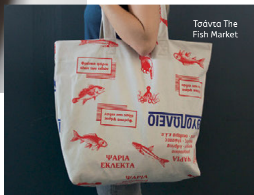
Τσάντα The Fish Market